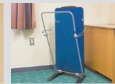
ズボンプレスナー貸出