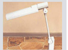
電気スタンド貸出