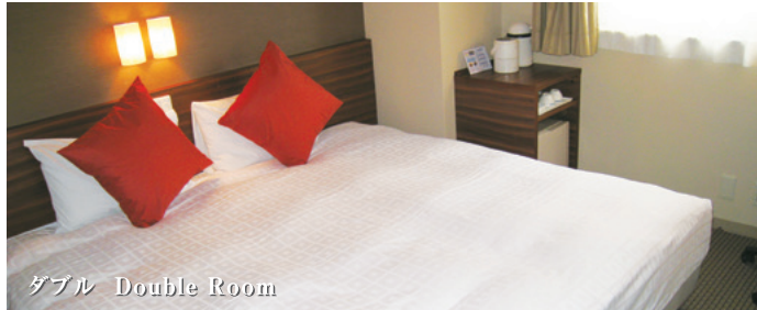
ダブル Double Room