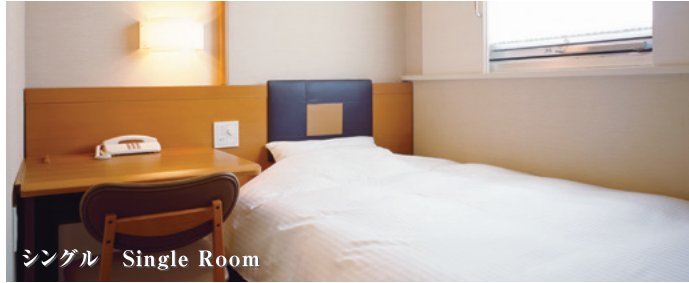
シングル Single Room