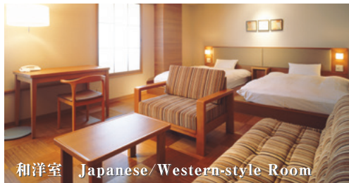
和洋室 Japanese/Western-style Room